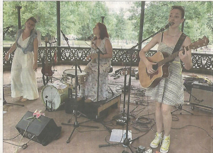
Le trio féminin The Cracked Cookies était à l'affiche du Kiosque en musique ce dimanche 16 août.

Deux autres concerts sont encore proposés d'ici fin août dans le cadre du Kiosque en musique du Contades : dimanche 23 août de 16 h à 18 h, rock, pop et chansons avec Jonas Gomar Seamer, et dimanche 30 août aux mêmes horaires, c'est donc The Very Gerry Quartet qui se produira – en lieu et place de l'harmonie fan-